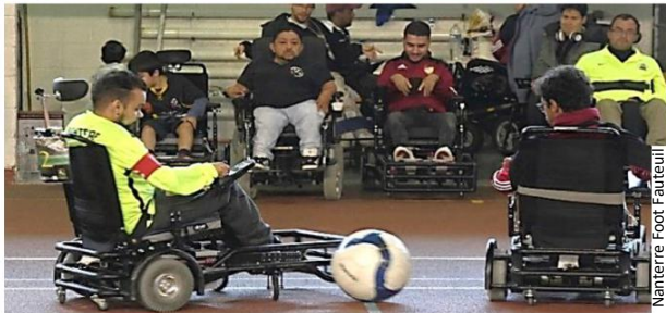
Nanterre Foot Fauteuil