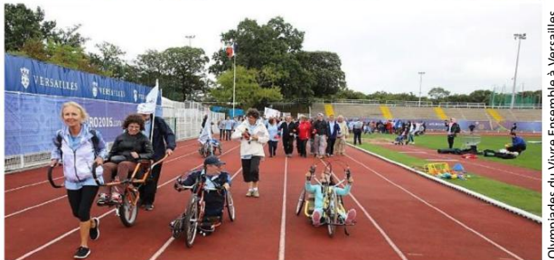
Olympiades du Vivre Ensemble à Versailles