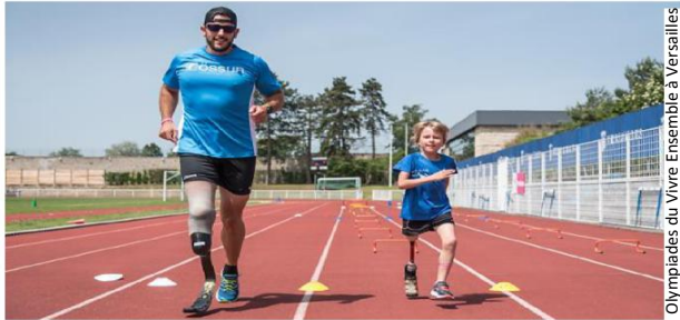
Olympiades du Vivre Ensemble à Versailles