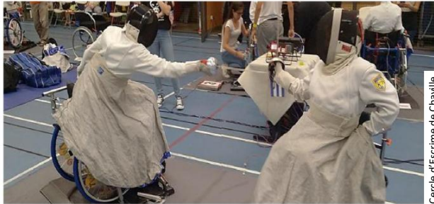
Cercle d'Escrime de Chaville

Ci-dessous quelques photos de nos actions 2018