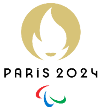
Badr TOUZI Parathlète Lancer de Poids F42/F63